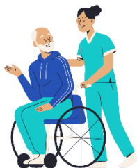
Voluntariat într-un azil de bătrâni