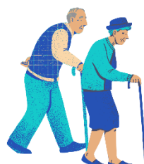
Ajutorarea persoanelor vârstnice din comunitatea ta