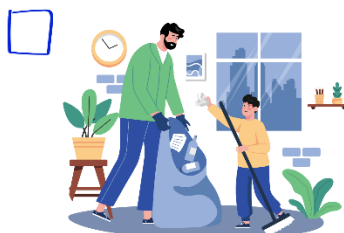
Colectarea deșeurilor (când ieși la plimbare)